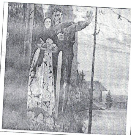
1 «Северная баллада»