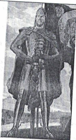
2 «Александр Невский»