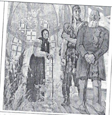
3 «Старинный сказ»